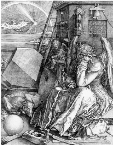
Abbildung 1: „Die Melancholie“ von Albrecht Dürer zeigt rechts oben die Darstellung einer Matrix (siehe vergrößerter Ausschnitt rechts). Die Matrix enthält ein „magisches Quadrat“.